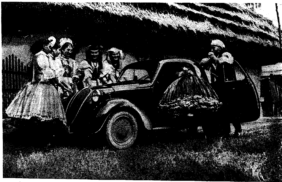
Scena cinematografica senza volerlo: la FIAT 500 nella campagna ungherese