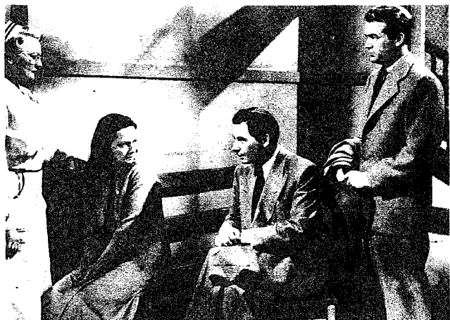
La funzione dello psichiatra è stata descritta, più o meno accuratamente, in una serie di film americani, di cui il più noto è il recente « The Snake Pit » (La fossa dei serpenti) di Litvak.

Ma anche la psicologia detta « superiore » ha delle buone ragioni per occuparsi del cinematografo. Così, p. es., la caratterologia, legata alla biopsicologia occupantesi della costituzione fisico-psichica dell'uomo, ha in quest'ultimi tempi cominciato ad interessarsi degli attori cinematografici. È il pregio