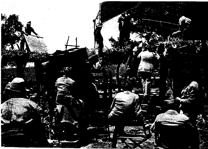
In alto e qui in basso: Schermi riflettenti e ombreglianti durante due riprese di 'Ramona' (Fox 20th Century)

Gli schermi, solitamente di forma rettangolare e sostenuti da appositi cavalletti, sono girati dagli assistenti dell'operatore secondo le esigenze della scena. Ci vuole molta sensibilità per stabilire con esattezza il loro numero, la loro posizione, l'inclinazione e la loro distanza dal soggetto... CIAK