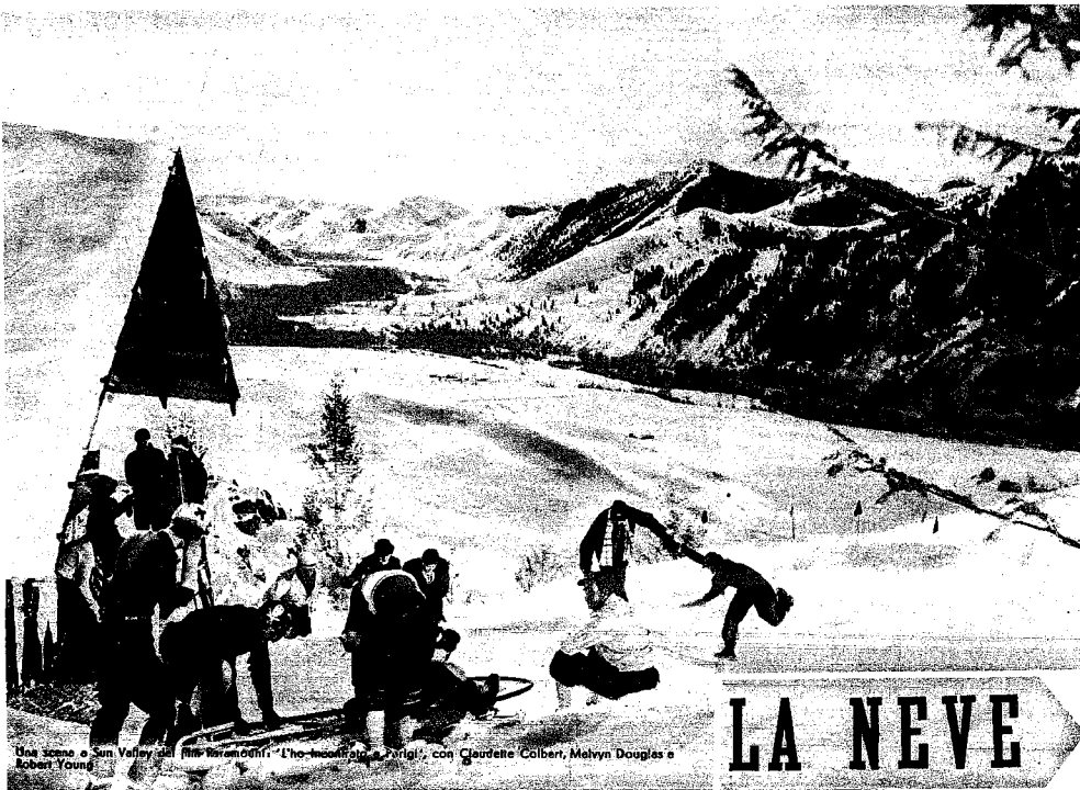
Una scena a Sun Valley del film "L'ho incontrato a Parigi", con Claudette Colbert, Melvyn Douglas e Robert Young