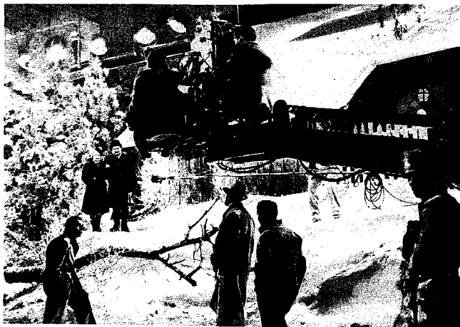
Nonostante l'alta temperatura estiva, si è trovato il modo di girare nello studio alcune scene invernali con neve artificiale per il film "One in a Million" della 20th Century Fox. Protagonista la compionessa di pattinaggio Sonja Henie

PELLICCE e mantelli si sono ormai ritirati nei loro armadi. Ma un vero fanatico del cinema non deve badare alle stagioni. Anche la popolazione semi-tropicale della California, che è press'a poco sotto la stessa latitudine degli Italiani del Sud, gode ormai del sole primaverile. Là, il termometro è salito fino a 90 gradi - gradi Fahrenheit, però, che corrispondono a circa 32 gradi di Celsius. Eppure, se il cartellone prevede la realizzazione di un film con Sonja Henie, Hollywood si deve coprire di ghiaccio e di neve. Giacché una campionessa mondiale di pattinaggio non può dimostrare la sua abilità se manca lo specchio del ghiaccio su cui ballare. Ecco perché i soggetti della 20th Century Fox hanno dovuto sfogarsi in fantasie invernali, e i tecnici costruire un campo di pattinaggio artificiale entro le mura del teatro di posa.