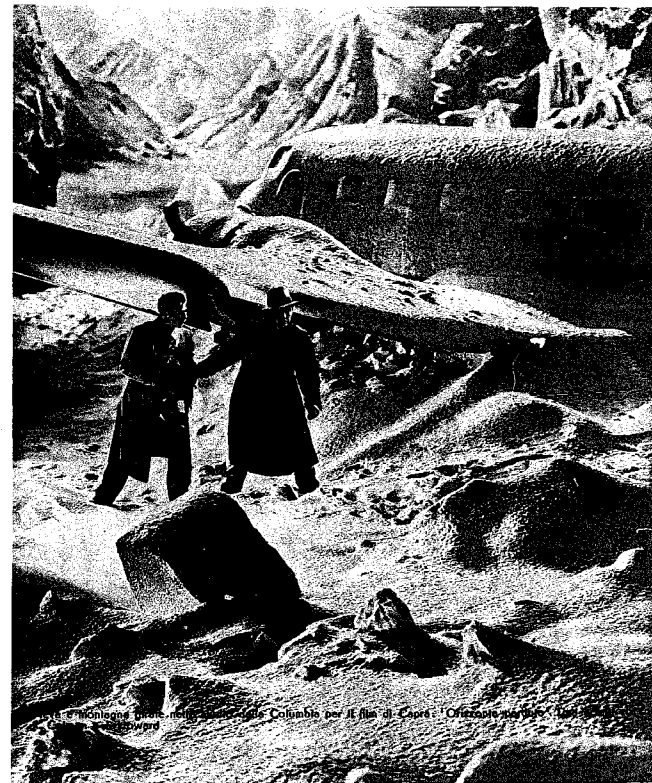
Le tecnologie girate nello studio di Capra per il film "Orizzonte perduto"

Insomma, si può dire che hanno tribolato abbastanza per incontrare quel tale a Parigi! Speriamo che, abbandonato il freddo del Monte Dollaro, i bravi lavoratori trovino un'accoglienza calda la sera della prima visione. CIAK