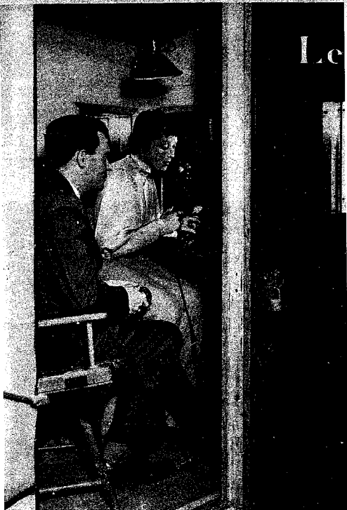
Nell'interno della cabina di registrazione.

S INCRONISMO? ASINCRONISMO? Son queste le due bandiere intorno a cui, più in teoria che in pratica, ferve la massima battaglia circa il modo di accompagnare il suono all'immagine nel fonofilm.