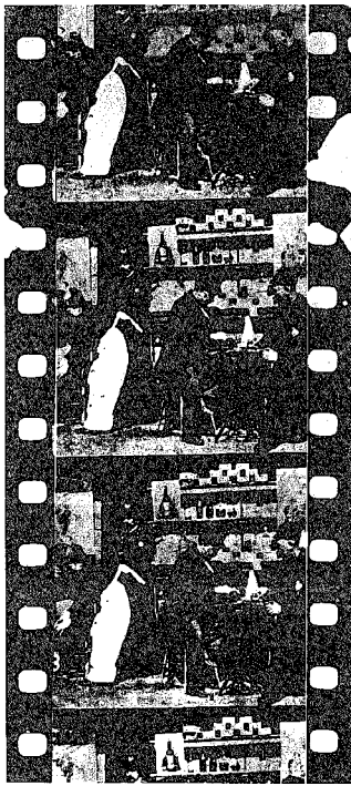
Film originale del Cinematoscopia di Edison (1893). La pellicola è del formato attuale di 35 mm.

licole riprese, stampate e proiettate con una loro macchina, sulla quale si basa la tecnica contemporanea. Sappiamo che anche in Europa sono state compilate delle storie del cinema, in cui si è cercato di ridurre il merito di grandi pionieri, per es., quello dell'Edison, in onore di un solo «inventore del cinema», ma non per questo potevamo lasciar passare senza commento l'esposizione del cronista americano. Dopo di che diamo la parola a Thomas Armat, contenti di saper ancora vivi fra noi alcuni testimoni della nascita del cinematografo, che ci sembra cosa antichissima e sempre esistita. ARMAT: La ringrazio, signor Daniel. Ritengo che il miglior modo di raccontare una storia sia quello di cominciare dal principio. Alla fine del 1894 vidi a Washington il Cinetoscopia di Edison e subito mi venne l'idea: «Quanto sarebbe meraviglioso se queste piccole immagini animate potessero essere proiettate su uno schermo, affinché le potesse osservare un intero pubblico, invece di una singola persona alla volta». Avevo preso brevetti e fatto invenzioni in altri campi tecnici, ma di cinematografo non ne sapevo niente. DANIEL: Signor Armat, non vorrebbe raccontarci come le venne in mente il principio della proiezione di film su schermo? ARMAT: Questa è una storia piuttosto lunga. La prima cosa che feci