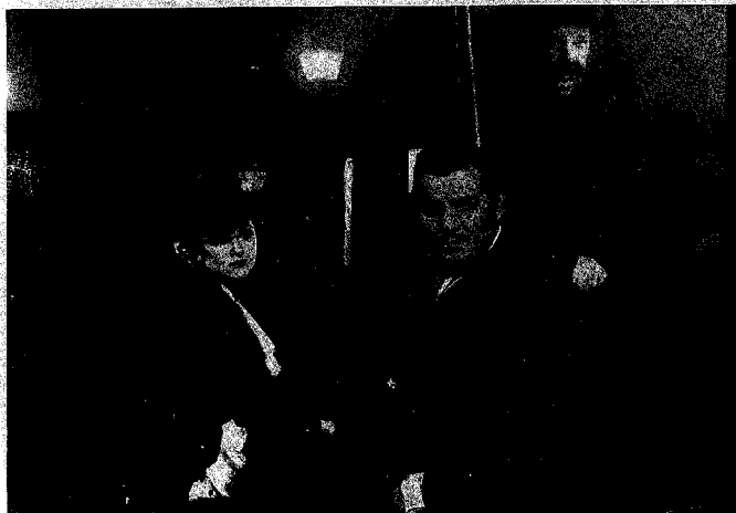
La nebbia di Dublino nel film 'Parnell'

IL SISTEMA più comune per fabbricare la nebbia in teatro di posa è quello dei coni fumogeni che vengono accesi e spargono un fumo denso capace di dare ottimamente l'effetto. Ma i coni fumogeni sono fastidiosissimi per gli attori e per tutti gli addetti alla ripresa. Perciò non è questo l'espedito ideale: tant'è vero che in Francia, ad esempio, si adopera ormai quasi dappertutto una macchina costruita dagli stabilimenti Mole-Richardson. In LA RIVA DEL DESTINO si potranno ammirare le nebbie provvedute dalla ingegnosa macchina.