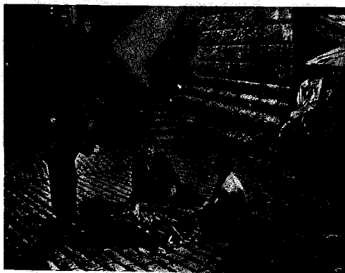
Un altro film dove la nebbia appariva abbondante: 'Sotto i ponti di New York'

Quando si vuol far funzionare la macchina, si comincia con lo